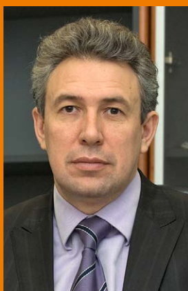
ГОРЬКОВ СЕРГЕЙ НИКОЛАЕВИЧ Председатель

Внешэкономбанк решает широкий комплекс задач, направленных на создание условий для долгосрочного устойчивого роста российской экономики, улучшения экологической обстановки и повышения качества жизни населения. Приоритетная задача – инвестиционная деятельность, обладающая высоким социально-экономическим и мультипликативным эффектом. За время выполнения функций национального института развития Банк одобрил участие в финансировании свыше 320 проектов общей стоимостью порядка 6 трлн руб. и объемом участия Банка более 3 трлн руб. Численность персонала – 2065 человек.