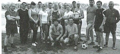
Выходной состав СКПР. Каждые два часа таких занятий оплачиваются предприятием.

яковского. Затем мужчины идут к турникам, девушки – в спортзал. Ну а дальше – игры с мячом, бадминтон, теннис, гири. Каждый выбирает себе занятие по вкусу, лишь бы на месте не сидел.